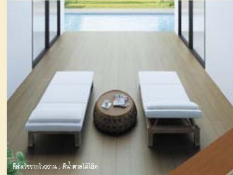
สีสำเร็จจากโรงงาน : สีน้ำตาลไม้โอ๊ค