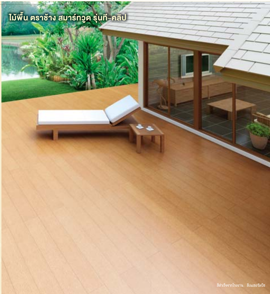
สีสำเร็จจากโรงงาน : สีเนเชอรัลบีช